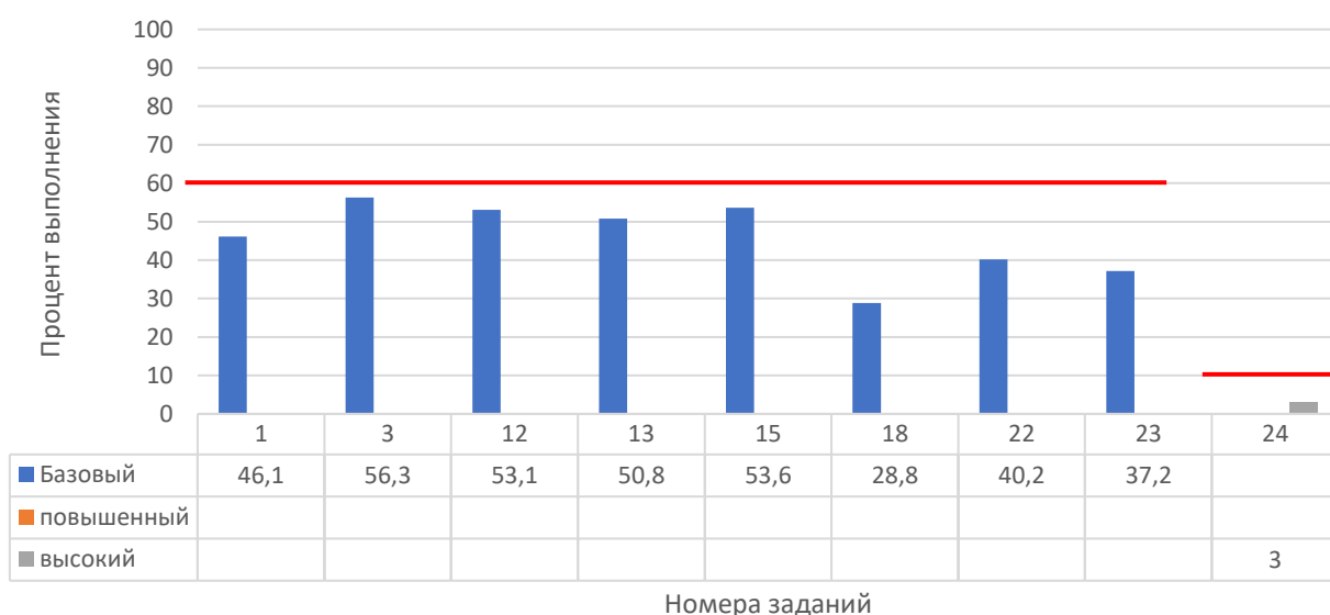
Рисунок 2. Задания, по которым участники не преодолели минимальный порог

На рисунке 2 представлены данные по заданиям (%), уровень выполнения которых не преодолел минимальный порог. Красной линией отражен минимальный порог выполнения для каждого уровня сложности: базовый – 60%, повышенный – 40%, высокий – 10%.